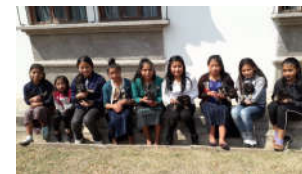
Jugando con perritos