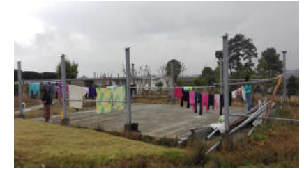
Tras el tornado

A principios de 2019 un fuerte tornado se llevó parte de la protección de las placas solares para el agua caliente y también el tejado de lámina del tendedero exterior. Este último resultó seriamente dañado y pidieron a Tacaná si podría contribuir a su reparación.