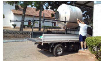
Transporte de una cisterna

El proyecto pretende dotar de medios para la recogida y almacenamiento de agua de lluvia a algunas comunidades dispersas por la montaña. Los trabajos comenzaron en enero pero se han visto entorpecidos por la aparición de la pandemia.