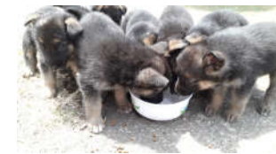
La camada completa