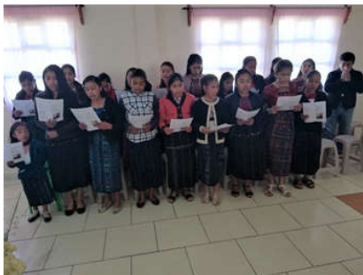
Las niñas cantaron durante la Misa