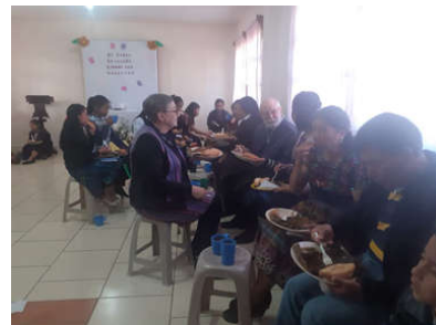
y se sirvió un refrigerio