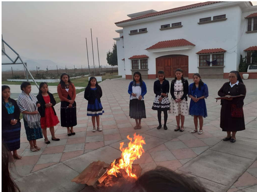
El fuego de Pascua arde en el patio delantero del Hogar Luis Amigó de Guatemala