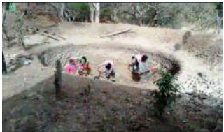
Lecho para cisterna

La población, que en gran parte mantiene una economía de subsistencia con el cultivo y la cosecha de pequeñas parcelas propias o arrendadas, se está viendo obligada a emigrar en busca de trabajo en otras zonas de Nicaragua o en Costa Rica donde ya hay más de un millón de nicaragüenses.